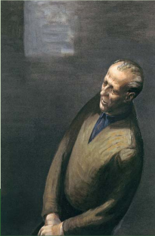
Tilman Kuhrt, »Mann VIII«, 1998, © VG Bild-Kunst, Bonn 2005

Akzeptanz Orientierung Struktur Gemeinschaft